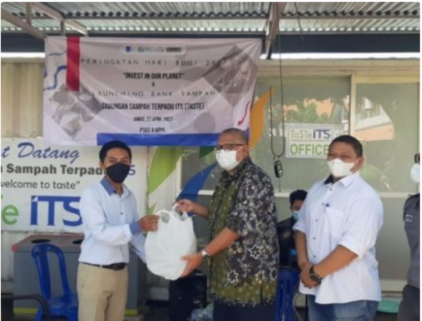
Serah terima sampah secara simbolis oleh Kepala Bank Sampah Surabaya (kiri), Wakil Rektor III ITS, dan Koordinator Sosial ITS Smart Eco Campus (tengah)

SURABAYA – Bertepatan dengan peringatan Hari Bumi, ITS Smart Eco Campus bersama Kelompok Pecinta dan Pemerhati Lingkungan (KPPL) Institut Teknologi